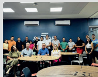
Palestra "Gestão Estratégica" em Itapipoca