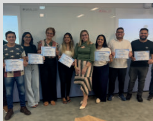
Curso "Gestão de pessoas - mód 3"