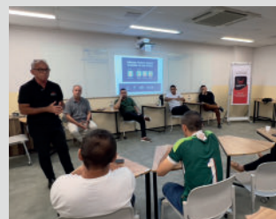
Roda de conversa com gestores