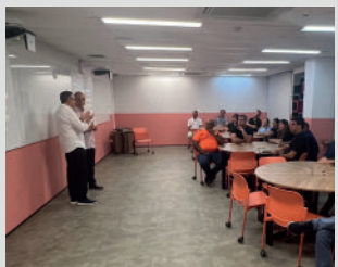
Aula - Processos internos da Oficina