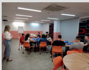
Curso "Gestão de pessoas - mód 1"