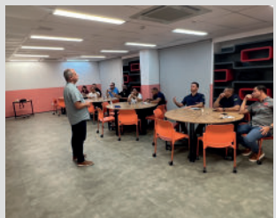
Aula - Gestão estratégica