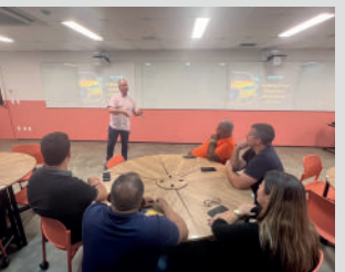
Aula - Modelagem da Oficina