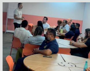
Palestra "Processos comerciais"