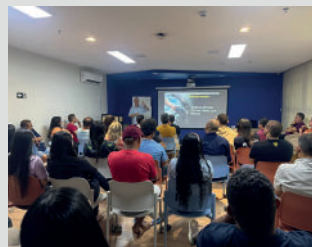
Palestra "Gestão Estratégica" em Tianguá