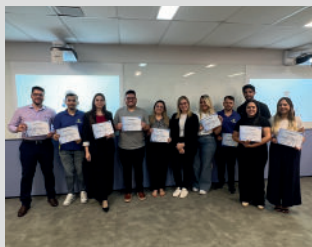
Curso "Gestão de pessoas - mód 2"