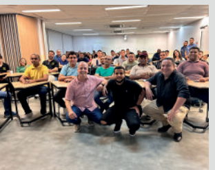
Roda de conversa com gestores