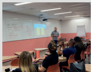
Aula - Estrutura e Organização