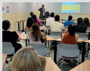
Palestra "NR01 - Riscos Psicossociais"