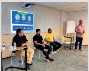
Roda de conversa com gestores